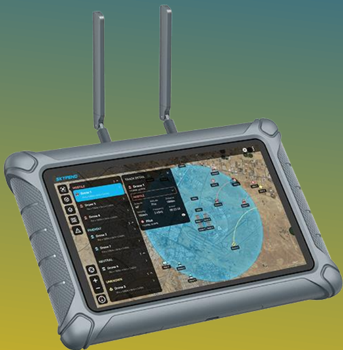
Skyfend C2 tablet